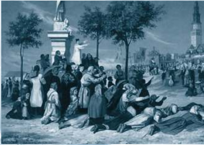
"Przybycie kompanii na Jasną Górę", Adrian Mikołaj Głębocki