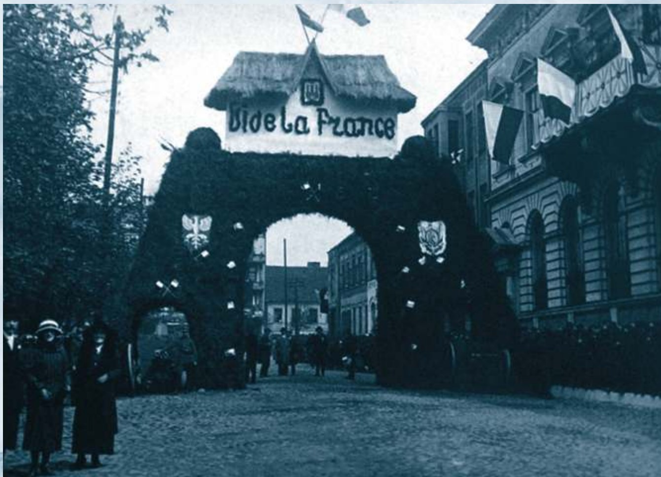
Brama tryumfalna samorządu częstochowskiego przy ul. Piłsudskiego wzniesiona na powitanie Ferdynanda Focha w 1923 roku, który otrzymał tytuł Marszałka Polski m.in. za wkład w odzyskanie przez Polskę niepodległości z 1918 r.