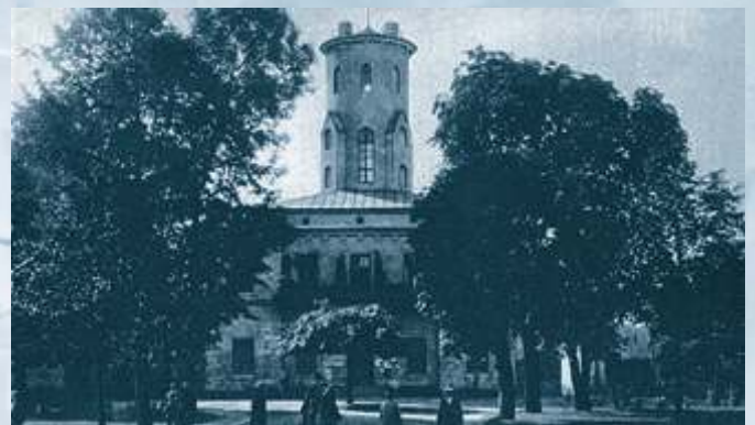
Ratusz, fotografia z lat dwudziestych XX wieku

Fragment planów pomiarowych z projektem uregulowania Miasta Częstochowy z lat 1822-1825