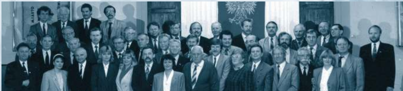
Rada Miasta Częstochowy pierwszej kadencji wyłoniona w wyborach samorządowych 27 maja 1990 r.